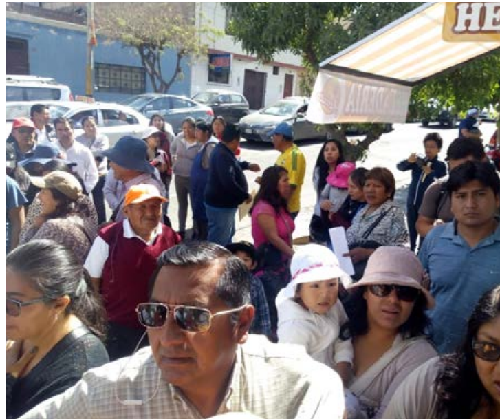
La población acudió masivamente para inscribirse y comprar su terreno.

Desde el lanzamiento del proyecto inmobiliario a la fecha se aprecia una gran expectativa por adquirir uno de los terrenos en “Ciudad Salaverry”. Las largas colas en las oficinas de San Martín 502 en el distrito de Miraflores así lo demuestran, así como las transacciones por más de 2 millones de soles con el apoyo de Caja Piura. Junto a ejecutivo de la financiera el 19 de junio se hará una conferencia de prensa para informar sobre la forma de financiamiento para poder adquirir uno de estos terrenos.