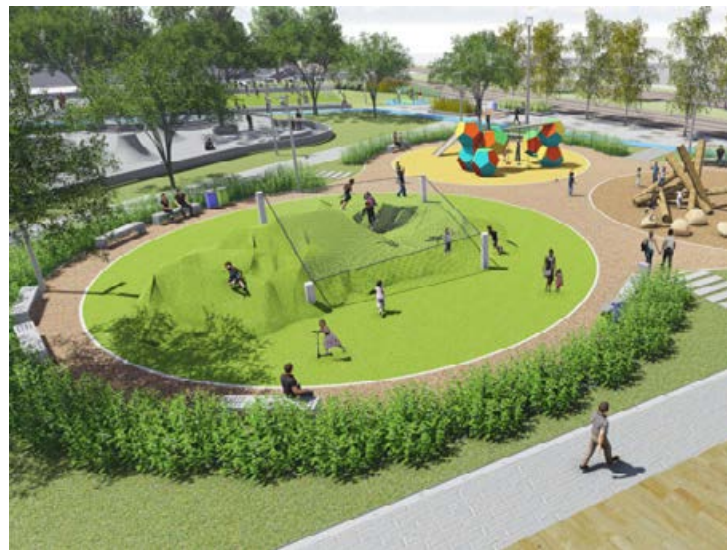
50% del terreno serán destinadas para áreas verdes.