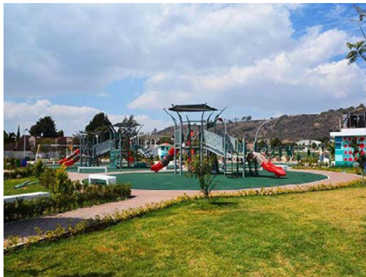
El programa contempla construcción de parques y zonas de recreación